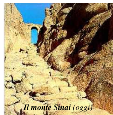
Il monte Sinai (oggi)

Ora giungono ai piedi di una montagna impressionante: il Sinai. Per la prima volta vedono un uragano sulla montagna. È un'esperienza meravigliosa e terrificante. Pensano che questi fenomeni indichino la presenza di Dio e la sua alleanza con il popolo.