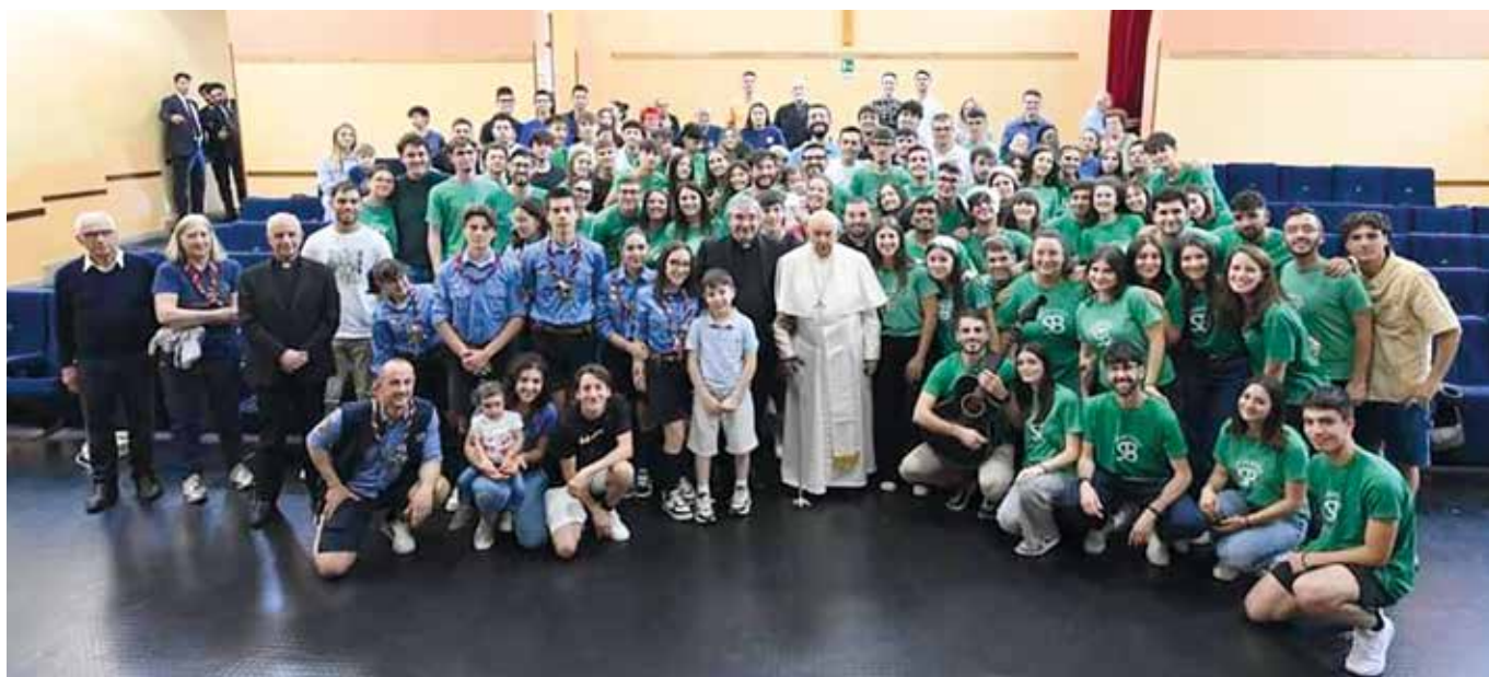
Papa Francesco nella parrocchia di Santa Bernadette con parroco mons. Giulio Villa