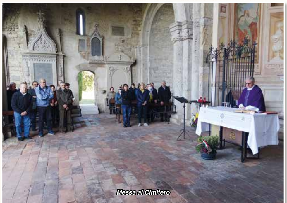
Messa al Cimitero

Ore 9,30-11,00: Possibilità di confessioni