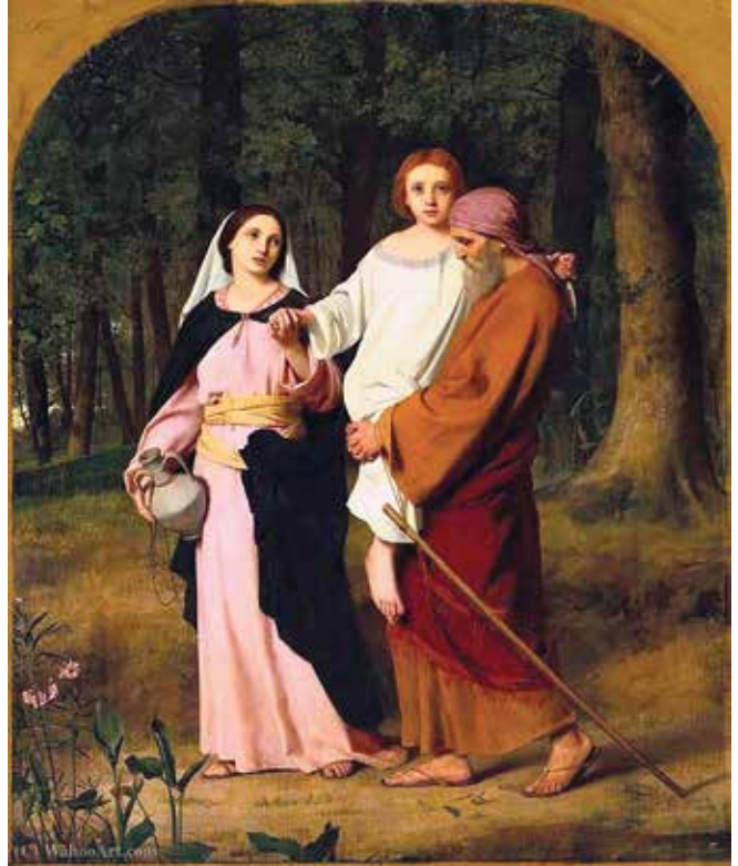
“Gesù Bambino ritorna a Nazareth con i genitori”

"I genitori di Gesù ogni anno andavano in pellegrinaggio a Gerusalemme per la festa di Pasqua. Quando Gesù ebbe dodici anni, lo portarono per la prima volta con loro secondo l'usanza. Finita la festa, ripresero il viaggio di ritorno con gli altri. Credevano che anche lui fosse in viaggio con la comitiva. Dopo un giorno di cammino, si misero a cercarlo tra parenti e conoscenti. Non riuscendo a trovarlo, ritornarono a cercarlo in Gerusalemme. Dopo tre giorni lo trovarono nel tempio: era là, seduto in mezzo ai maestri della legge: li ascoltava e discuteva con loro. Tutti quelli che lo udivano erano meravigliati per l'intelligenza che dimostrava con le sue risposte. Anche i suoi genitori, appena lo videro, rimasero stupiti,