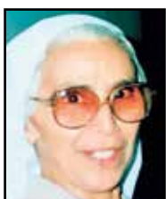
GEROSA suor EMILIA + 20/7/2019