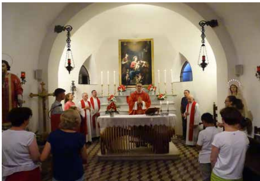
Cerimonia del 10 agosto 2023 - Festa di San Lorenzo

In questo centro abitato, nella prima metà del XIV secolo, sono documentate due luoghi di culto, un piccolo "Oratorio" dedicato a S. Maria Elisabetta, ora scomparso,