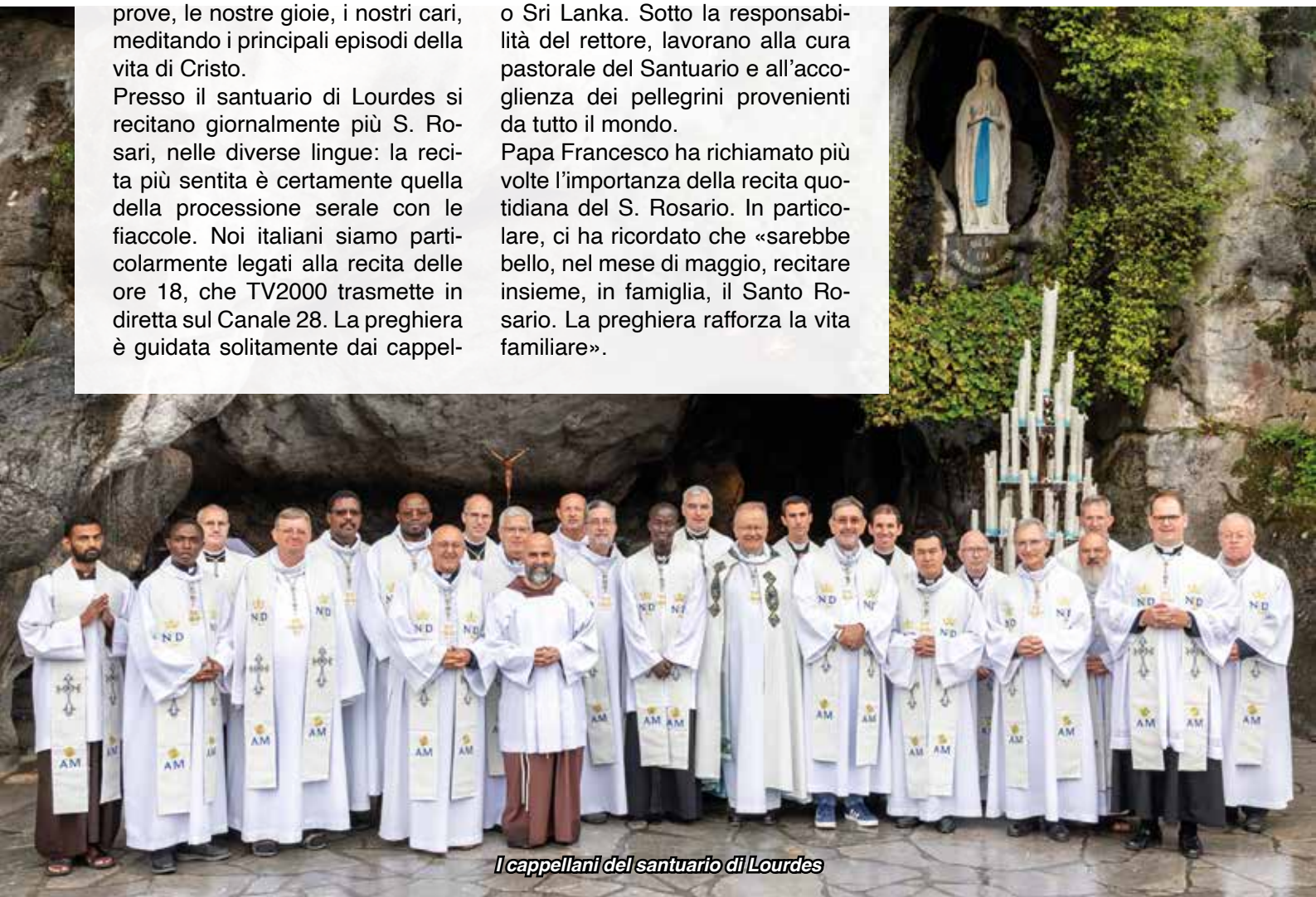
I cappellani del santuario di Lourdes