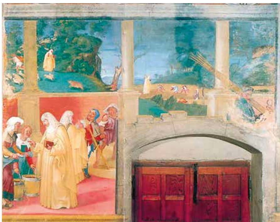
"Cappella Suardi" - affreschi, 1524 - Trescore Balneario

è collocato sulla porta d'ingresso, esattamente di fronte alla figura del Cristo Vite.