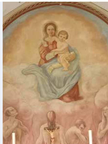
L'immagine della Vergine alla cappella "dei Murti" di Filago (via Pascoli)

Cuore Divino di Gesù e Cuore Immacolato di Maria, riempite di gioia e di luce la vita dei ministri della Chiesa, perché nella serenità delle loro relazioni testimonino la bellezza e la grazia della loro vocazione.