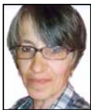
RONCALLI MARIA + 9/3/2023