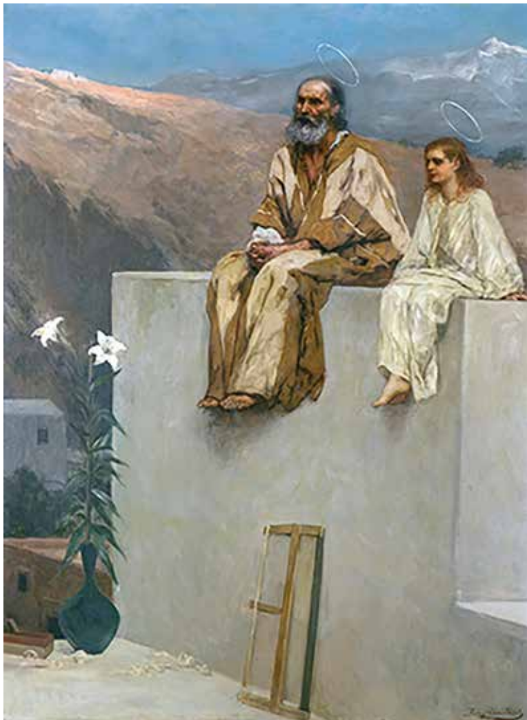
"San Giuseppe padre adottivo di Gesù"

olio su tela 130 x 95 cm, inizio XVIII sec.