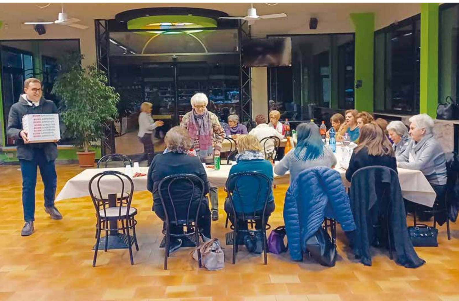
I volontari, che curano la cucina durante le feste all'oratorio, in un momento di agape amichevole.

O Gesù, che con la tua risurrezione hai trionfato sul peccato e sulla morte, e ti sei rivestito di gloria e di luce immortale, concedi anche a noi di risorgere con te, per poter incominciare insieme con te una vita nuova, luminosa, santa. Opera in noi, o Signore, il divino cambiamento che tu operi nelle anime che ti amano: fa' che il nostro spirito, trasformato mirabilmente dall'unione con te, risplenda di luce, canti di gioia, si lanci verso il bene. Tu, che con la tua vittoria hai dischiuso agli uomini orizzonti infiniti di amore e di grazia, suscita in noi l'ansia di diffondere con la parola e con l'esempio il tuo messaggio di salvezza; donaci lo zelo e l'ardore di lavorare per l'avvento del tuo regno. Fa' che siamo saziati della tua bellezza e della tua luce e bramiamo di congiungerci a te per sempre. Amen.