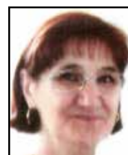
VILLA MARGHERITA + 18/7/2017