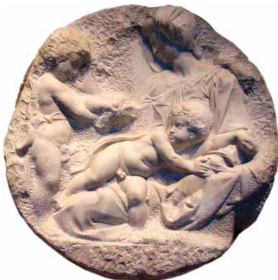
“Madonna col Bambino e san Giovannino (Tondo Taddei)”

San Giovanni e la Madonna si dividono lo spazio circolare, mentre la figura di Gesù viene posta al centro trasversalmente. È la figura dove Michelangelo ha lavorato di più, dove le ombre si fanno più marca-