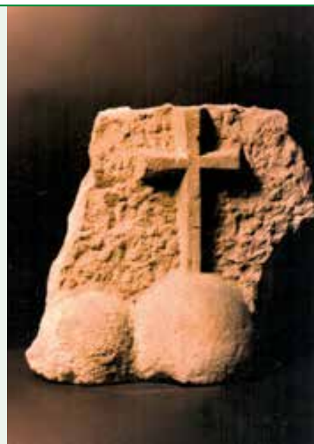
Frammento in pietra con Croce scolpita.

R ilevata nell'aprile del 1984, murata nella parete a nord in alto a sinistra, durante i lavori di definitiva sistemazione e intonacatura della Chiesa di S. Giorgio, adiacente alle case dell'allora Beneficio parrocchiale. È un frammento in pietra che porta scolpita una Croce che poggia su di un tondo, con altro di dimensione più piccola, sicuramente era parte dell'antica chiesa parrocchiale, precedente a quella ora esistente, un particolare di un portale, di una finestra? Una testimonianza dell'antica chiesa parrocchiale, della quale purtroppo non vi è più traccia.