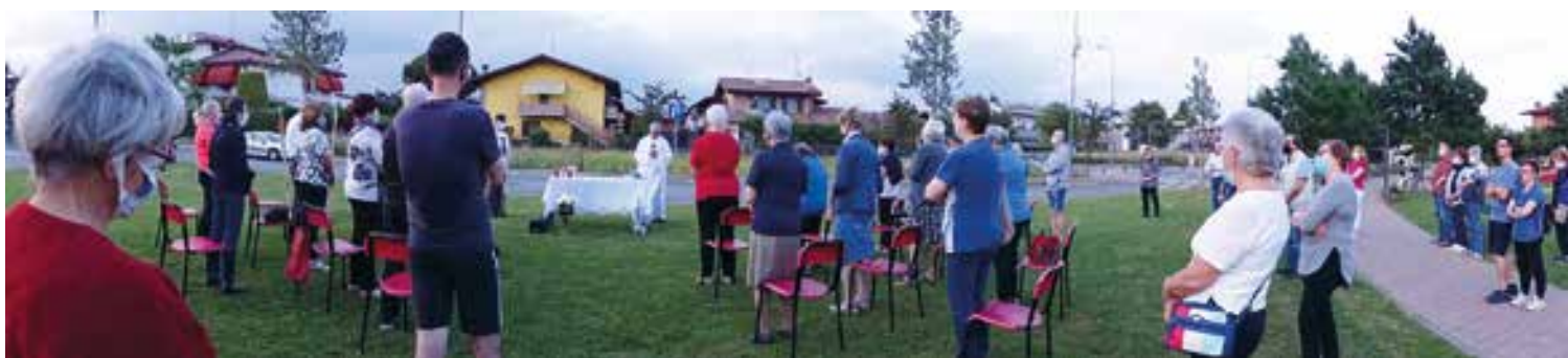
Parco di via Beltrami