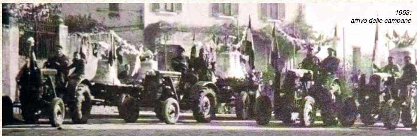
1953: arrivo delle campane