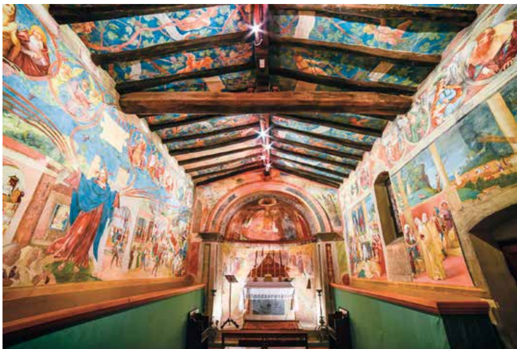
“Cappella Suardi” affreschi, 1524 - Trescore Balneario

Gli affreschi di Lotto occupano tre pareti e il soffitto: sul muro dinnanzi